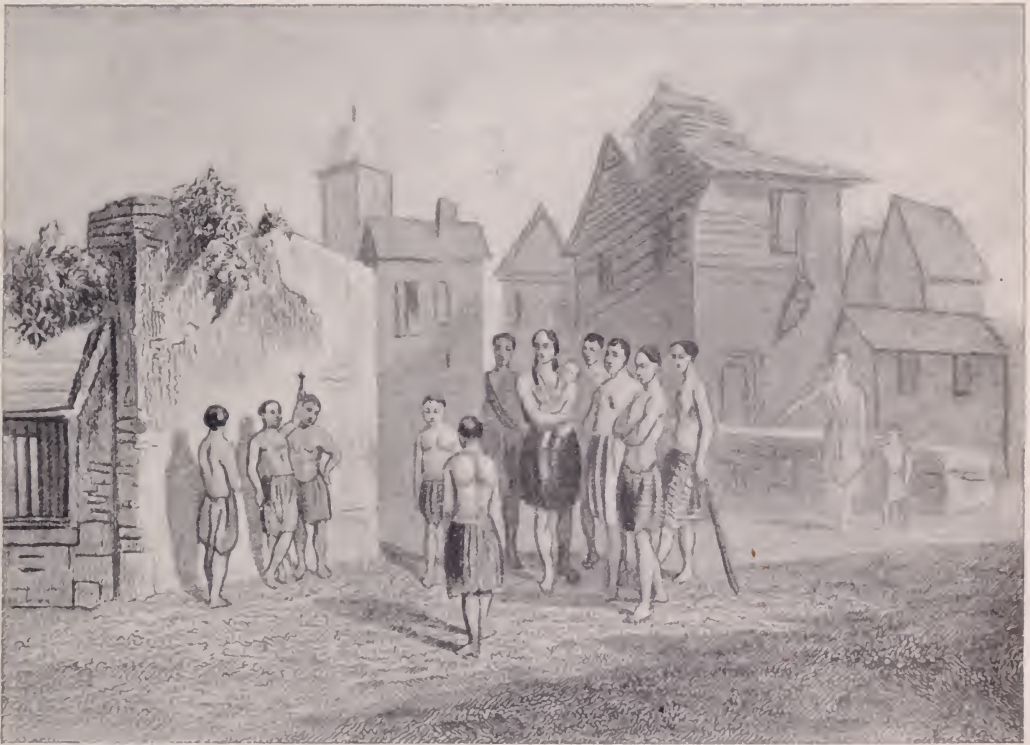
Catequistas indígenas. (Grabado francés del siglo pasado).